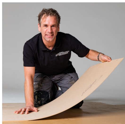
Avjämnning och nytt golv på 1 dag, inget behov av spackling.

Jumpax® installeras flytande vilket ger en god stegljudsisolering. Förväntad stegljudsisolering är över 21 dB.