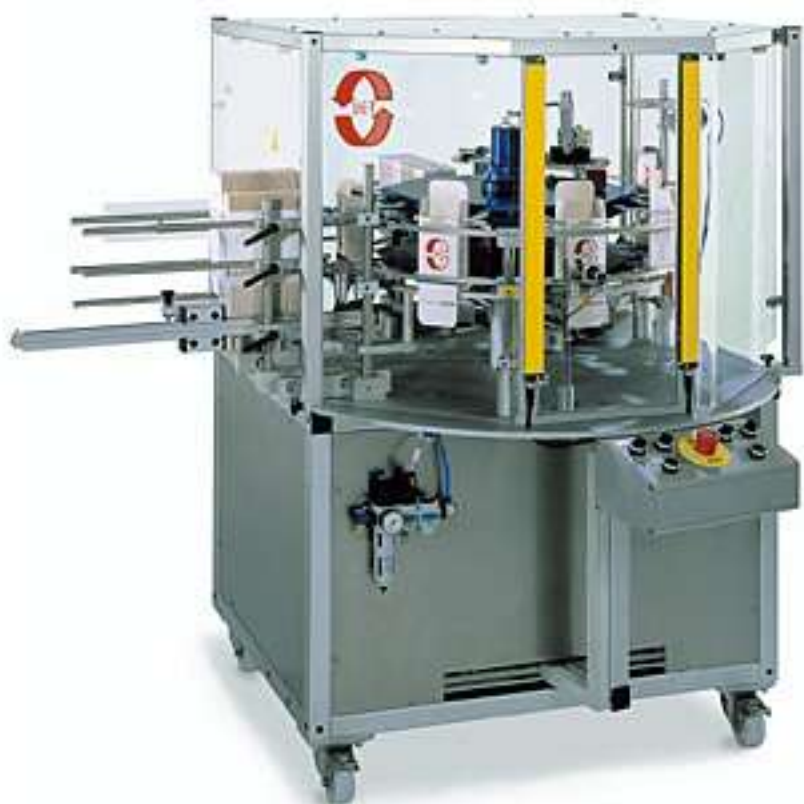
Vertikale Kompakt-Kartonier-Maschine Vertical Compact Cartoning Machine